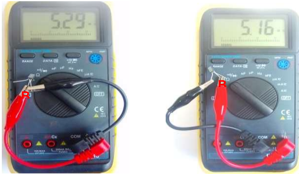
Figura 5.10 Identificarea BAZEI tranzistorului bipolar