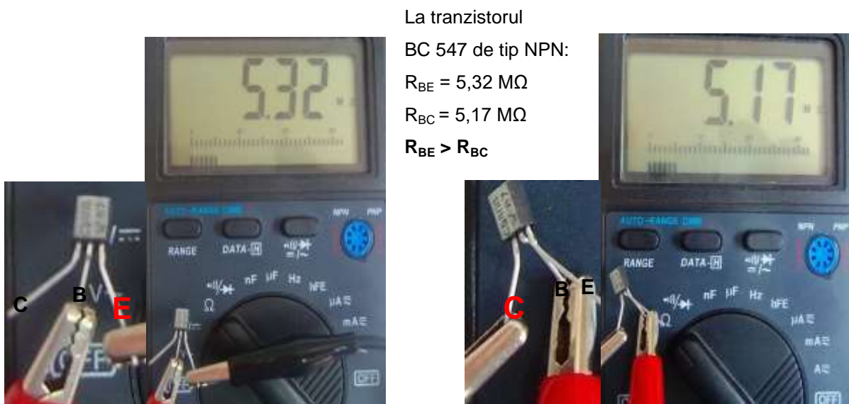
Figura 5.12 Identificarea EMITORULUI și COLECTORULUI

Rezistența BAZĂ-EMITOR este mai MARE decât rezistența BAZĂ-COLECTOR.